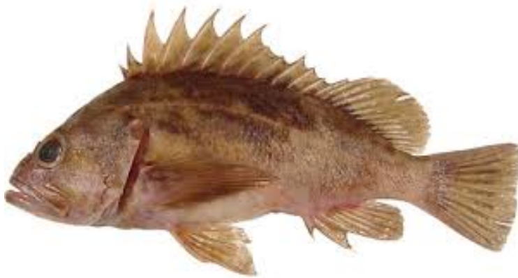
Rockfish - 10 尾, 無尺寸限制