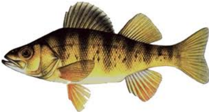
Perch - 10 尾, 無尺寸限制