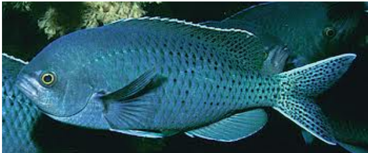
Blacksmith – 10 尾, 無尺寸限制