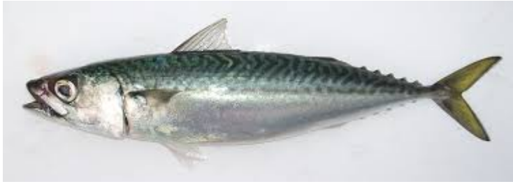
Mackerel – 無任何限制