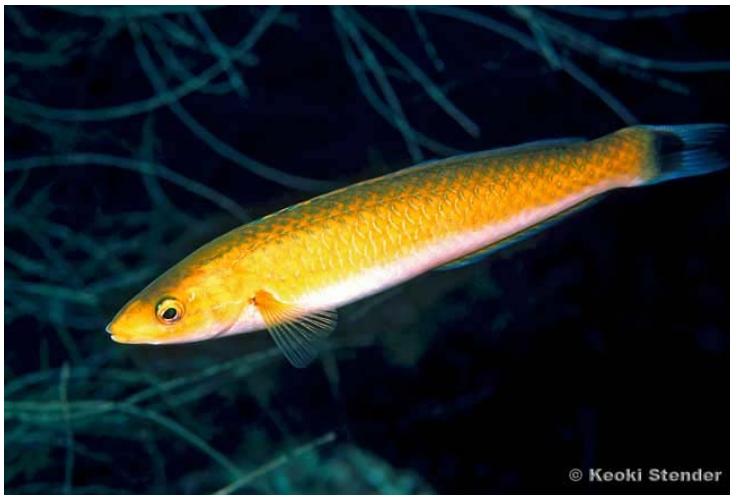
Senorita – 10 尾, 無尺寸限制