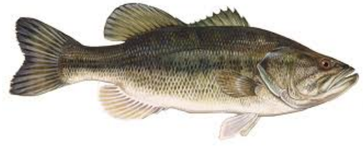
BASS – 全品種合計 5 尾, 14 英吋