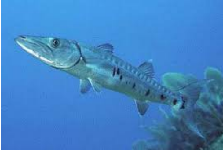
Baracuda – 10 尾, 28 英吋