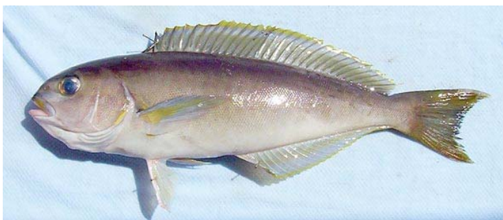
Ocean Whitefish - 10 尾, 無尺寸限制