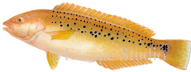
Rock Wrasse - 10 尾, 無尺寸限制