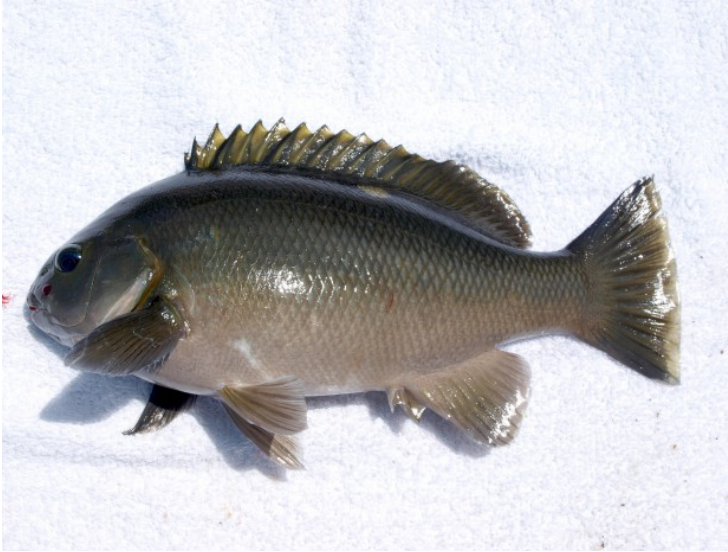
Opaleye - 10 尾, 無尺寸限制