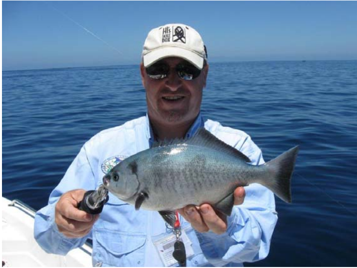
Halfmoon – 10 尾, 無尺寸限制