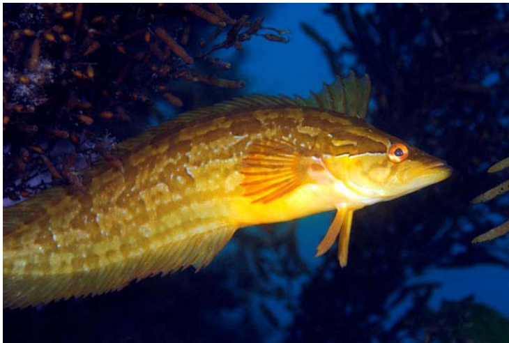
Kelpfish – 10 尾, 無尺寸限制